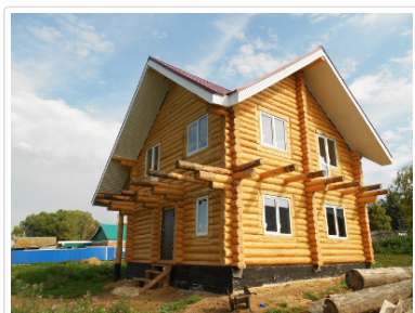
Фото построенных домов